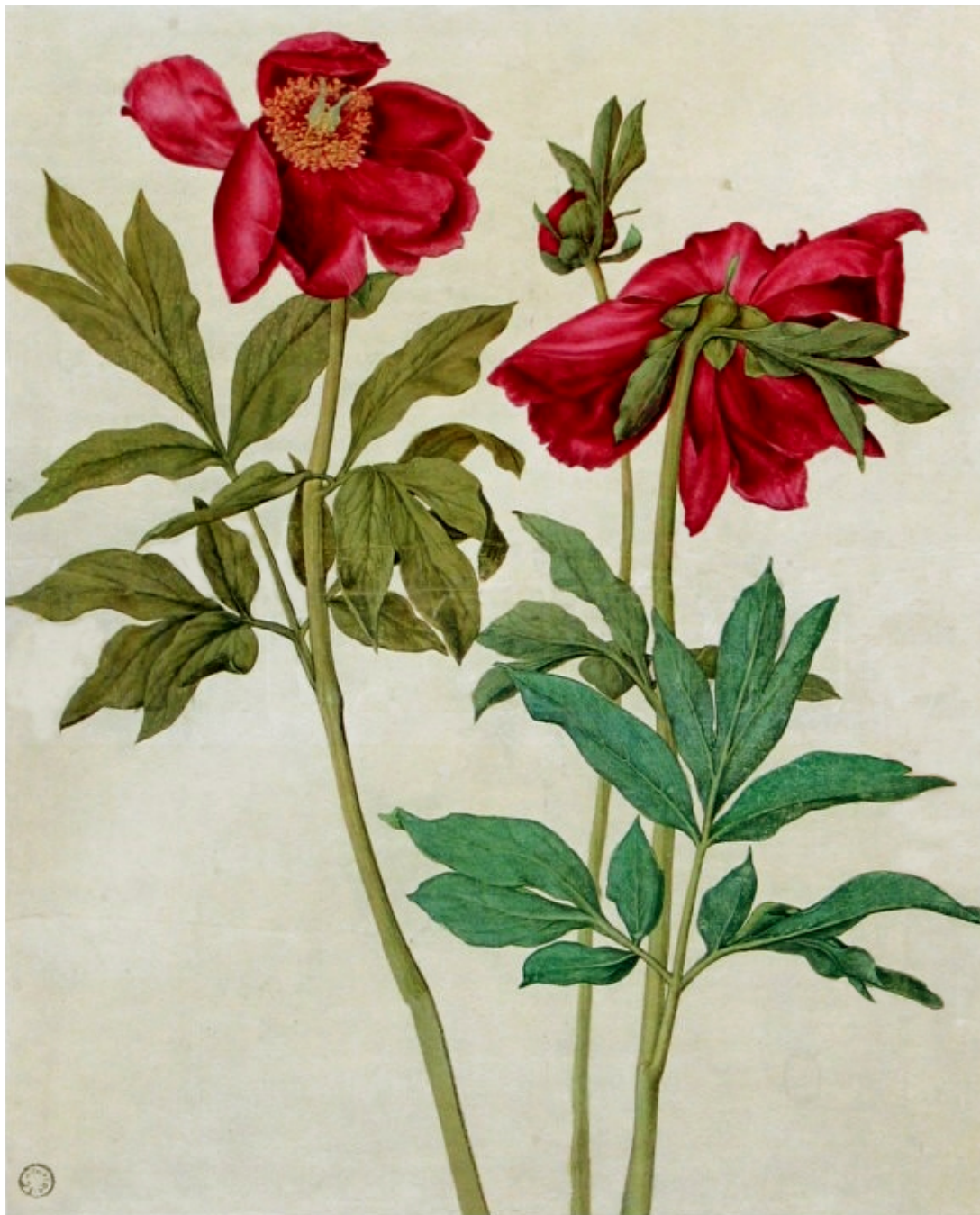
Albrecht Dürer: Pfingstrosen 1505, Kunsthalle Bremen