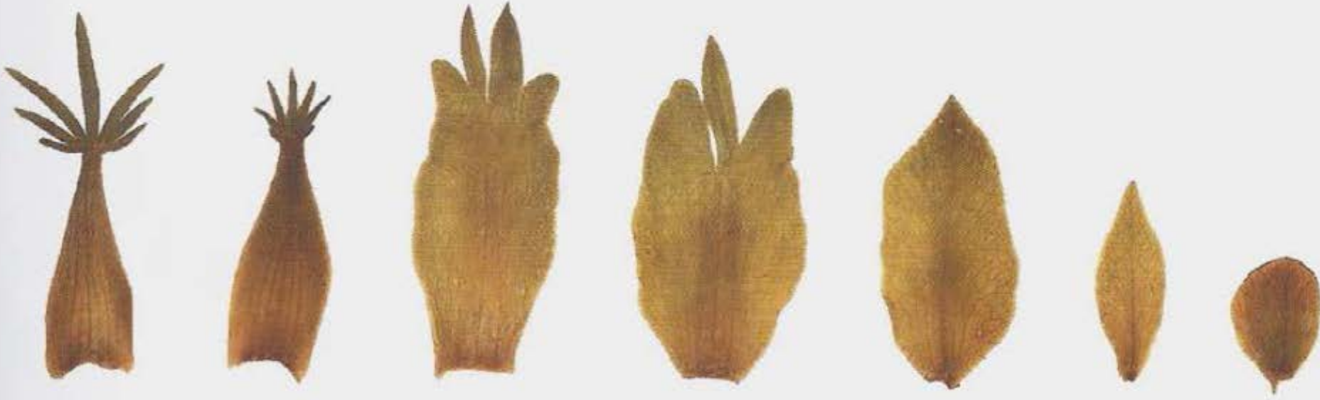
Andreas Suchantke Metamorphose – Kunstgriff der Evolution, Stuttgart 2002