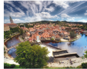
UNESCO-Stadt Český Krumlov / Krummau

Die Reihe Quellen der Gesundheit knüpft an die fünfjährige IPMT Ausbildung zur Anthroposophischen Medizin an, welche von 2010-2014 in Krummau stattfand. Sie setzt das bewährte Konzept fort und öffnet sich verstärkt für alle Gesundheitsberufe mit dem Ziel einer interprofessionellen Zusammenarbeit. Dies zeigt sich auch in der Gliederung des Programms in sowohl fachübergreifenden wie fachspezifischen Themen.