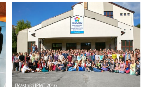
Účastníci IPMT 2016