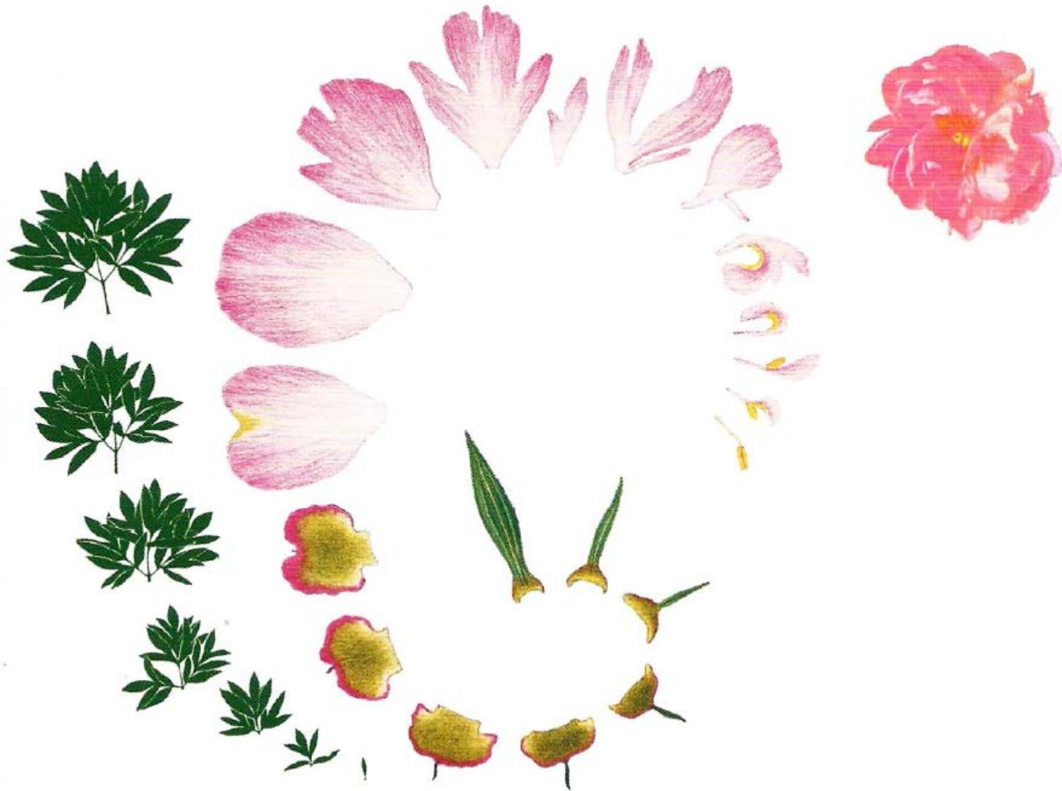
Andreas Suchantke Z knihy Metamorphose – Kunstgriff der Evolution, Stuttgart 2002